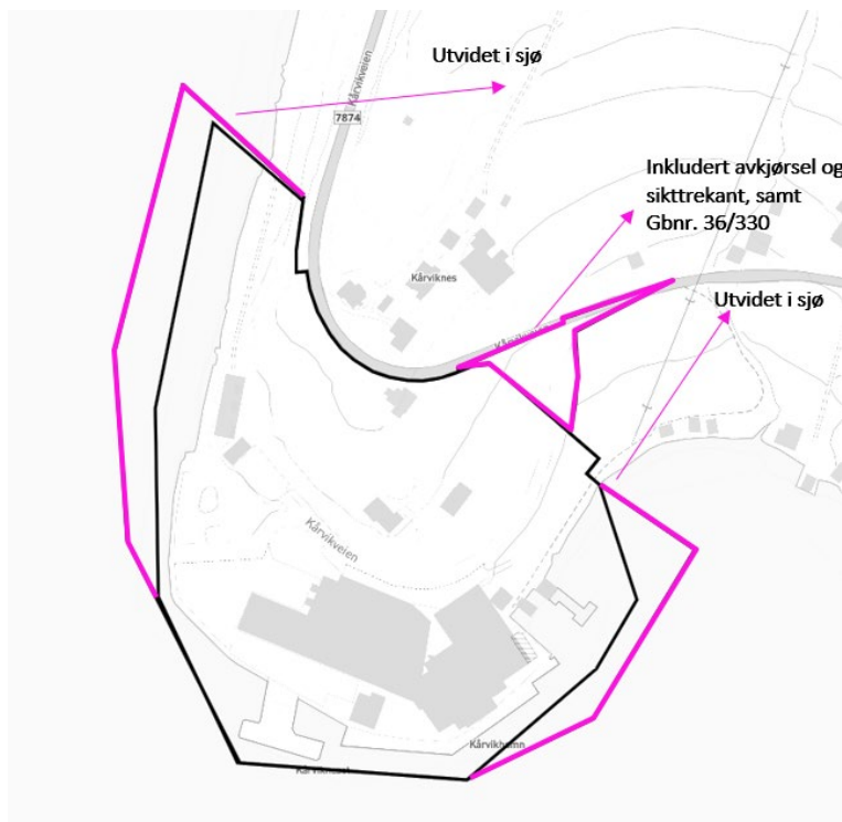
Figure 2: Endringer av plangrense.

Planområde tidligere annonsert (26.02.2021) var 50,6 daa. Nytt planområde varslet i dette brev er 59,5 daa.