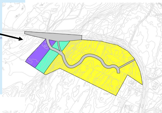
Figur 2: foreløpig skisse over formål